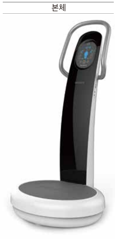
몸체와 바닥 분리 포장 가능